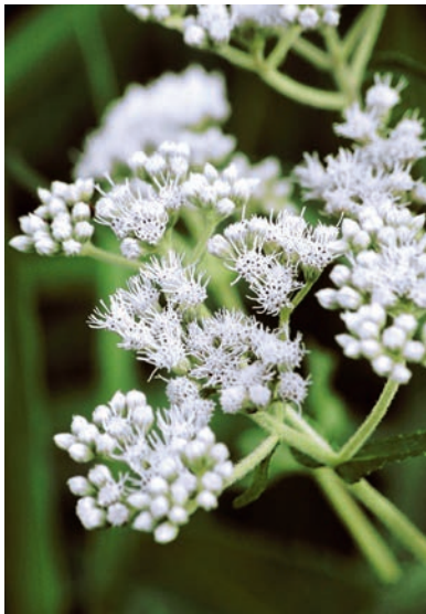
Eupatorium perfoliatum ist besonders angesagt bei Atemnot

Zink ist ein essenzielles Mineral, besonders in Bezug auf die Immunfunktion. Es stärkt die Aktivität einiger Komponenten des Immunsystems, u. a. der T-Zellen.