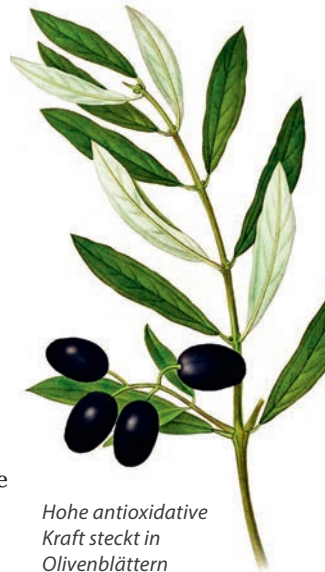
Hohe antioxidative Kraft steckt in Olivenblättern

Das Baikal-Helmkraut, eine Pflanze aus der Familie der Lippenblütler mit großen, auffälligen blauviolett-blauen Blüten, ist in China, der Mongolei und angrenzenden Teilen Russlands verbreitet. In der Traditionellen Chinesischen Medizin ist es unter dem Begriff „Huang qin“ bekannt. Verwendet wird hauptsächlich die Wurzel. Baikal-Helmkraut weist ein großes antivirales Wirkspektrum auf. Es hemmt die Verschmelzung zwischen Virus und Zelle und infolgedessen die Virusreplikation, also die Vermehrung der Erreger. Darüber hinaus reguliert Helmkraut die angeborene antivirale Abwehr des Wirts. Helmkraut wirkt vor allem bei Atemwegserkrankungen wie Lungenentzündung, aber auch aufgrund seiner fiebersenkenden und auswurfördernden Eigenschaften bei Fieber und Husten. Sehr zu empfehlen ist das Baikal-Helmkraut als Tinktur (z. B. bei Kräuter Schulte erhältlich), 3-mal täglich 15 Tropfen.