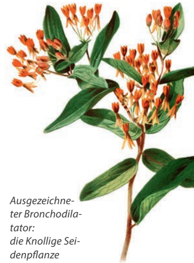
Ausgezeichneter Bronchodilatator: die Knollige Seidenpflanze

• Knollige Schwalbenwurz oder Knollige Seidenpflanze ( Asclepias tuberosa ) ist eine Pflanzenart aus der Gattung der Seidenpflanzen ( Asclepias ). In der Volksmedizin wird die Pflanze als bevorzugtes Mittel bei Rippen- und Brustfellentzündung angewandt, weshalb sie auch die volkstümliche Bezeichnung „Pleurisy Root“ erhalten hat. Asclepias tuberosa verbessert die Zilienfunktion, senkt den Tonus der Bronchialmuskulatur, wirkt dadurch bronchienerweiternd und auswurfördernd. Sie ist zudem fiebersenkend. Empfehlenswert ist die homöopathische Verdünnung D6 ( DHU ).