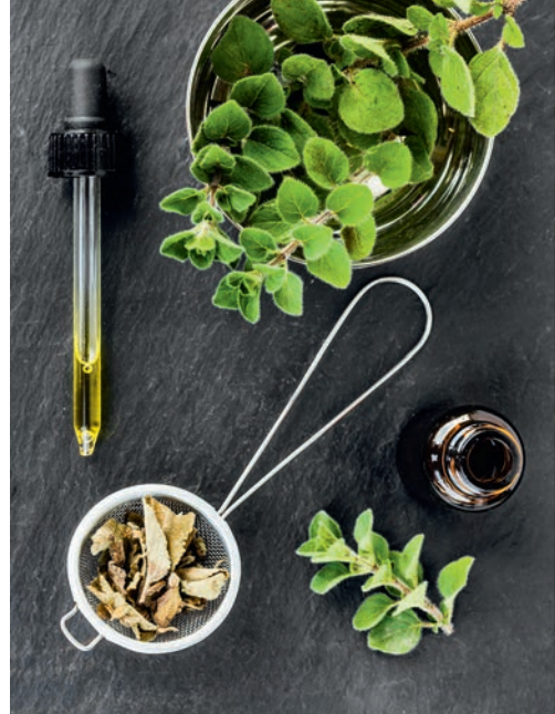
Aus dem Oregano wird eines der potentesten ätherischen Öle gewonnen

Der Eukalyptus gehört zu den Myrtengewächsen. In Australien, wo er beheimatet ist, zählt das Eukalyptusöl zu den wichtigsten Heilmitteln. Es hat keim- und entzündungshemmende, schleimlösende und auswurfördernde Eigenschaften und eignet sich daher